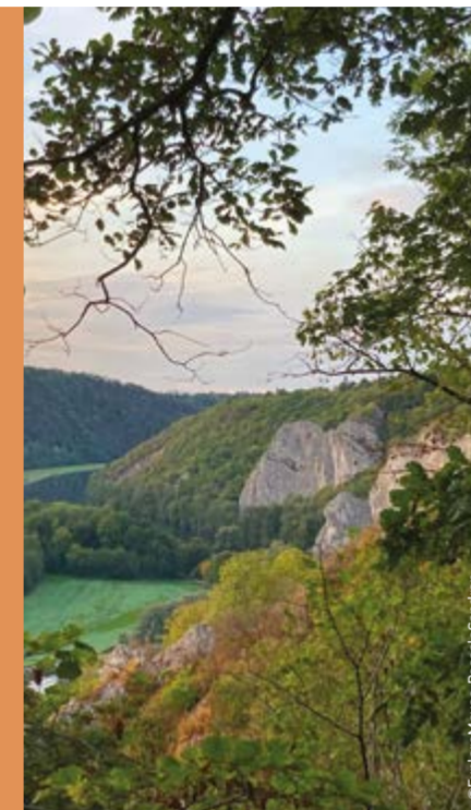
E Les Cascatelles

Enfin, d'un point de vue purement esthétique, le ravin est assez impressionnant par sa profondeur.