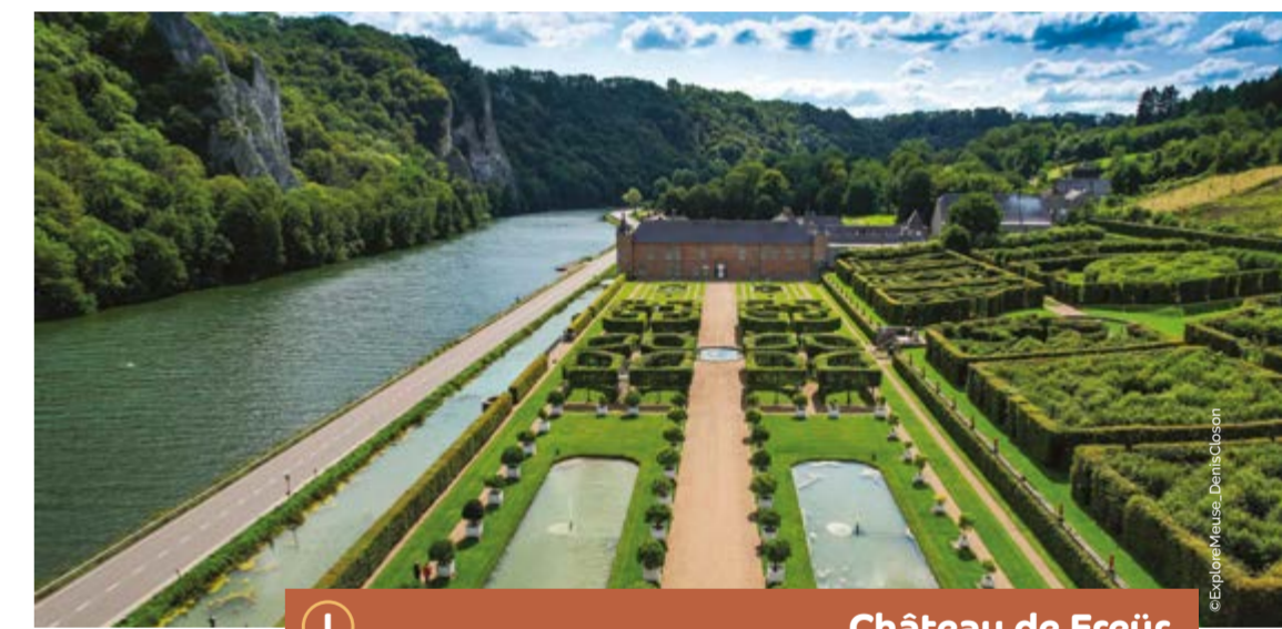
I Château de Freÿr